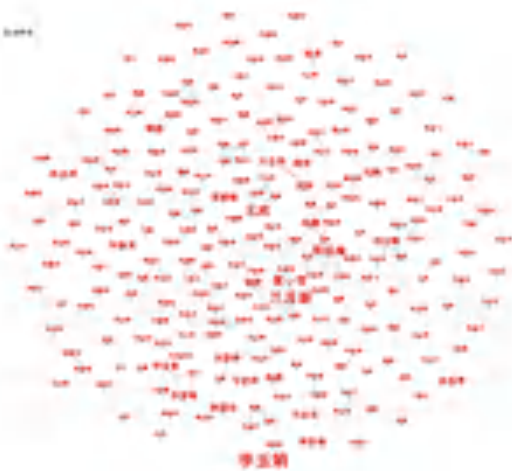
图 2 作者共现知识图谱

作者共现图谱可以帮助了解该领域关键作者之间的合作关系。在 CiteSpace 中将节点类型选为“合作作者”,时间设置为 2010~2024 年,得出作者知识图谱(见图 2)。图 2 中显示,2010~2024 年间有 247 位作者研究涉警网络舆情,共 105 条合作连接线。图 2 中形成了 5 个较大的合作群体,以兰月新、周廷瑜、张鹏、林星韵、宋全喜为中心,合作时间集中在 2017 年附近。近两年合作减少,主要以两人合作为主。