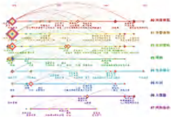
图 6 关键词时间线图

在关键词聚类的基础上,在 CiteSpace 上方菜单栏中点击“Timeline View”,得到关键词时间线图(见图 6),可以看出不同关键词随时间变化的整体趋势。按照不同关键词在本领域出现的时间顺序,可以将涉警网络舆情研究分为 3 个阶段:起步阶段(2010~2015)、发展阶段(2016~2020)、成熟阶段(2020 至今)。对此可展开阐释分述如下。