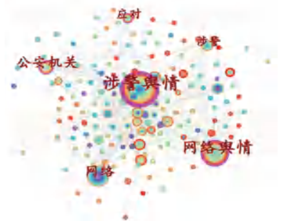
图4 关键词共现知识图谱

涉警网络舆情原因被归结为社会背景和个体因素两方面。在社会背景层面,牛广甫 [3] 和韦炜 [4] 指出,社会转型催生公民法治意识的觉醒,这是网络舆情形成的内在动因;杨博娟 [5] 、杜季宪 [6] 、倪荫林 [7] 等学者认为互联网的飞速发展改变了信息传递方式,进而也催生了涉警网络舆情的大范围传播。在