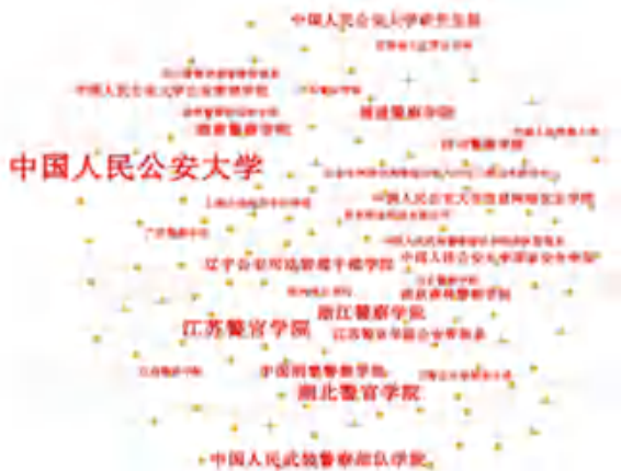
图3 发文机构共现知识图谱

词见表2。根据表2,频次前14的关键词中,“涉警舆情”、“网络舆情”等主题词的中心性超过0.1,具有较大影响力。此外,“公安机关”、“警察”、“自媒体”、“新媒体”等主体及“大数据”、“舆论引导”、“应对策略”、“治理”等应对方式也是该领域的研究热点。